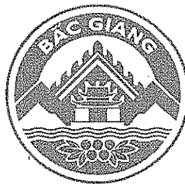
Hình 2. Mẫu đen trắng